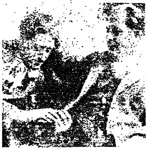
مع الفنان خليل الصليبي

لا بد أولا من اعتذار مصحوب بنفس عميق ، في أن تتكسر قيصر الجليل عبر هذه الجريمة المزدوجة ، لنسك أن ثمة واجبا قويا في أدائه المتقنون والمسؤولون ، والقائسون انفسهم على كل الصعده ، وهو الاهتمام بما تركه قيصر الجليل من نتاج فني ، وإعادة تقييم هذا الفنان ووضع في إطاره الفني الصحيح كرائد مزرواد الحركة الفنية الحديثة ووحد من مؤسسي التعليم الفني في لبنان ، ومعلم يدين له الكثيرون من الفنانين المعاصرين بيننا .